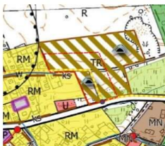
Granica obszaru objętego sporządzeniem planu miejscowego