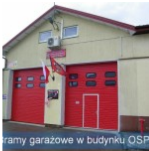
ramy garażowe w budynku OSP