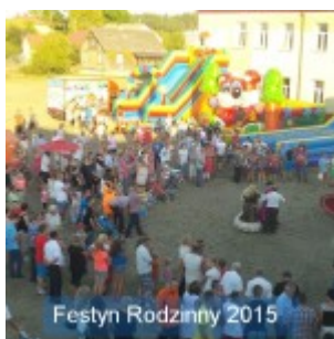
Festyn Rodzinny 2015