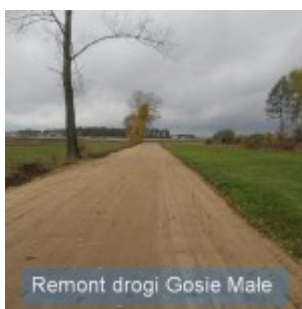
Remont drogi Gosie Małe