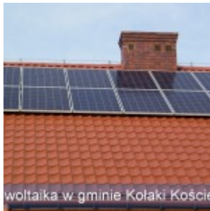
woltaika w gminie Kołaki Koście