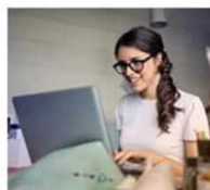
E-USŁUGI PUBLICZNE I BEZPIECZEŃSTWO W INTERNECIE