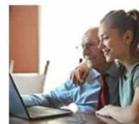
PODSTAWY OBSŁUGI KOMPUTERA I INTERNETU