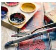
HOBBY I ROZWÓJ OSOBISTY ONLINE