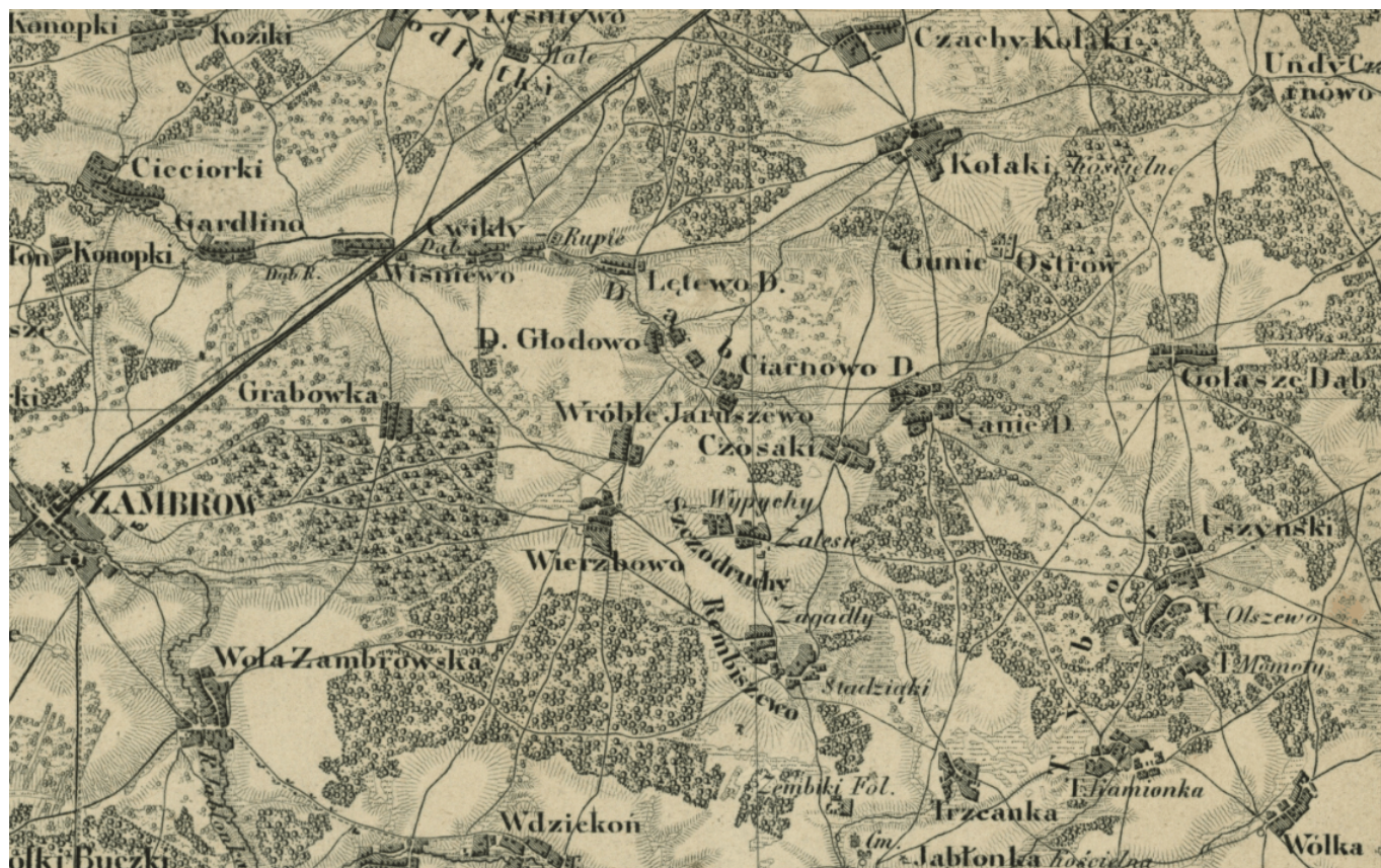
Kołaki Kościelne na mapie z 1850 r.

Sama wieś Kołaki Kościelne powstała w XV wieku z nadania w ok. 1416 roku przez księcia Janusza I, 30 włók ziemi Wojciechowi herbu Kościeszka z Kołak Jaćwiężyna (obecna gmina Grudusk w woj. mazowieckim). Osiedla wiejskie pochodzą w dużej części z kolonizacji drobnej szlachty zagrodowej. Wiele wsi charakteryzuje się dwuczłonowymi nazwami, co związane było z podziałami rodzinnymi ziem poszczególnych rodów i tworzeniem przysiółków.